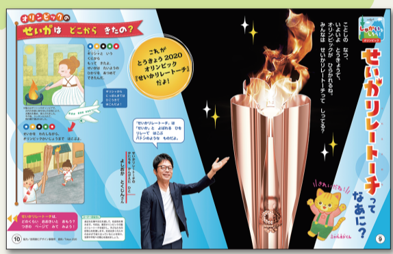
わんだあらんど 「ワンダーランド2020 ねん4がつごう」 こおなあ しゃかいコーナー(P.9～10)より