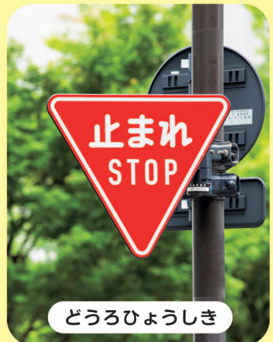
どうろひょうしき