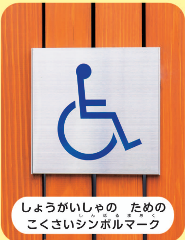
しょうがいしゃの ための こくさいシンボルマーク